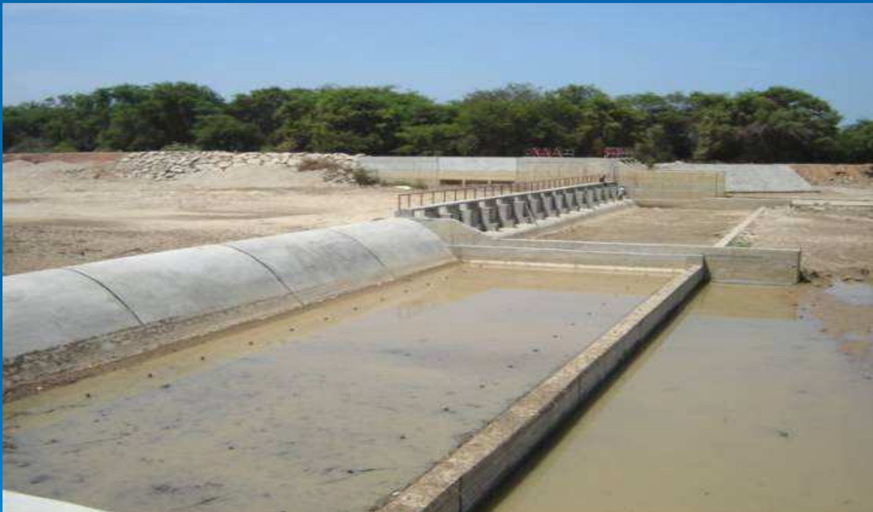
Barraje fijo y módulo de ataguías, totalmente construido