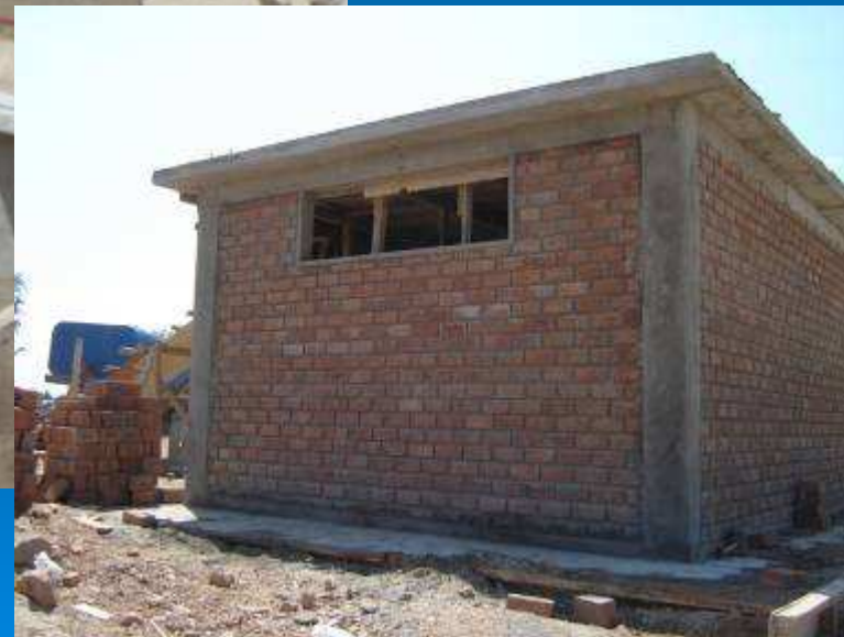
Dique de encauzamiento aguas abajo y caseta - almacén