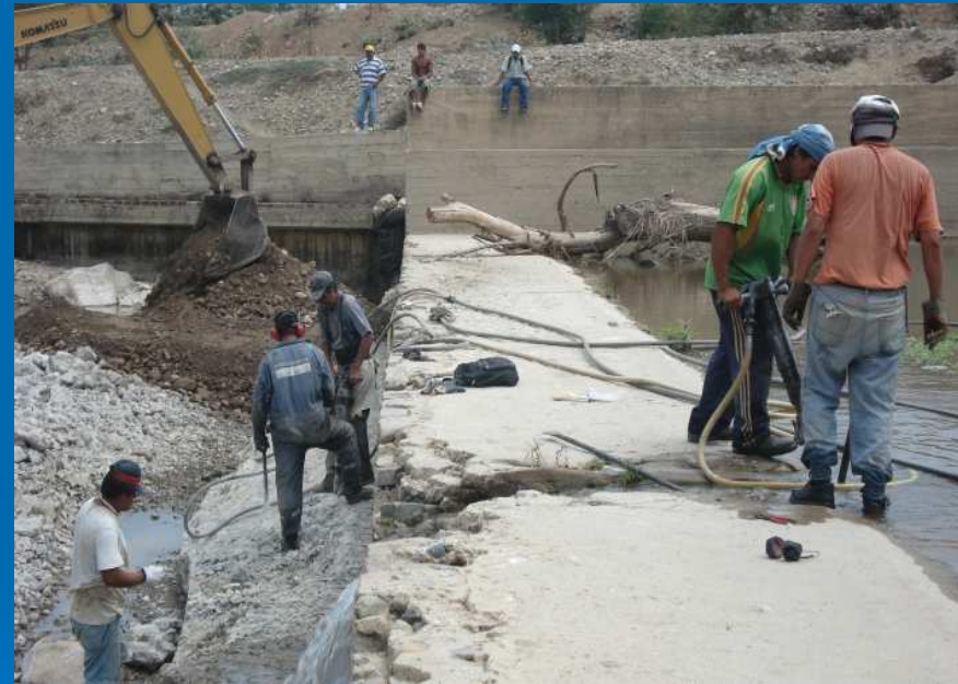
Demoliciones en bocatoma Magdalena